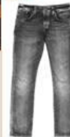
Pantalones tecnológicos Barcelaga 2017