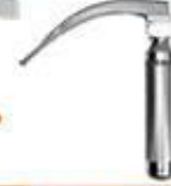
Laringoscopio Manuel García 1855