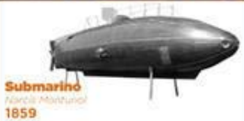
Submarino Narcís Monturiol 1859