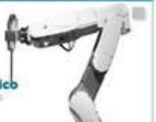
Robot Quirúrgico Instituto Maimónides 2015