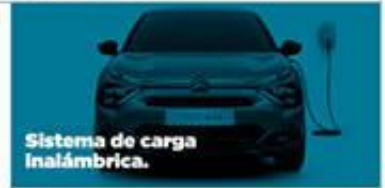
Sistema de carga inalámbrica.