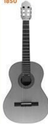
Guitarra Española Antonio Torres Jurado 1850