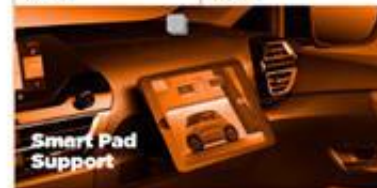
Smart Pad Support