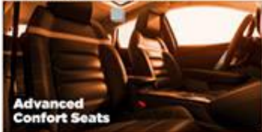
Advanced Confort Seats